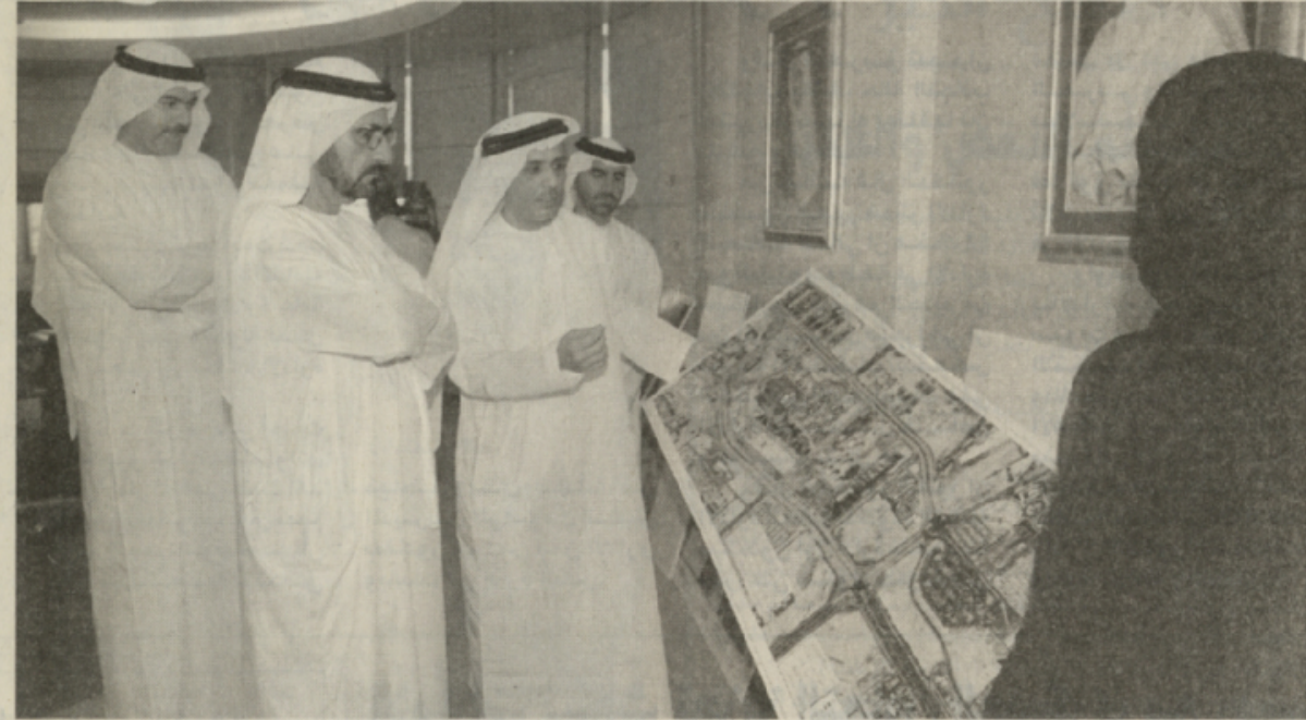
محمد بن راشد يستمع الى شرح من مطر الطاير بحضور محمد القرقاوي

علوي جديد على الطريق هذا الى جانب تحسين وتطوير التقاطع الخامس على الطريق ذاته بحيث يضاف تقاطع علوي حر يوفر انسيابية المرور في كل الاتجاهات.